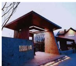
物業發展及投資物業