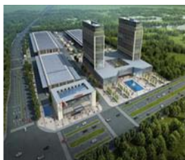
建築工程及 建築材料供應

於二零二一年十二月三十一日，本集團有六個主要分部，分別為(i)地基工程、上蓋建築工程及建築材料供應；(ii)物業發展及投資物業業務；(iii)物業管理；(iv)餐飲供應鏈；(v)健康及醫療服務；及(vi)智慧物流及資訊技術發展。我們尋求在各分部之間實現協同價值，以取得更高回報及更大商機。