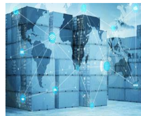
智慧物流及資訊技術